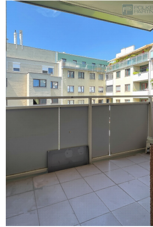
Loggia Zimmer 3