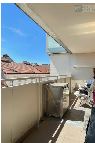
Terrasse - Loggia