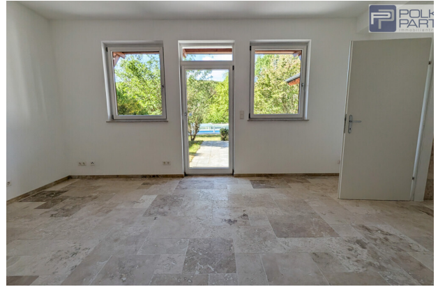
Gästewohnung im Gartengeschoss