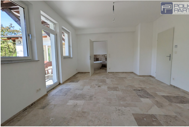
Gästewohnung im Gartengeschoss