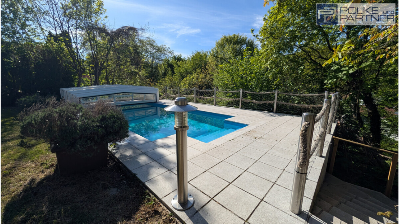
Pool 8m x 5 m mit Abdeckung