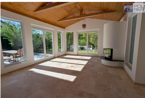
Wintergarten Mit Kamin