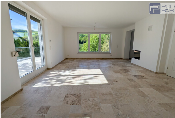
Wohnbereich mit Terrasse