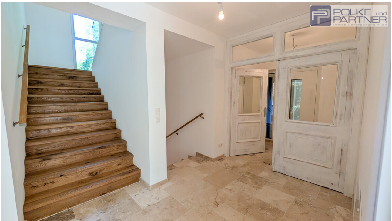
Eingang mit Garderobe und Gäste-WC