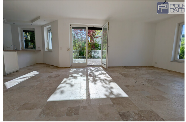
Wohnbereich mit Terrasse und Kamin