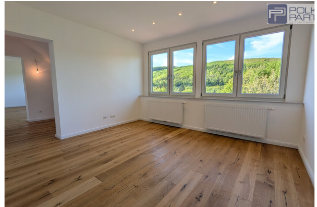
Schlafzimmer mit Wienewaldpanorama