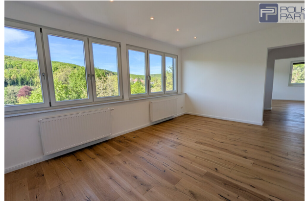
Schlafzimmer mit Wienewaldpanorama