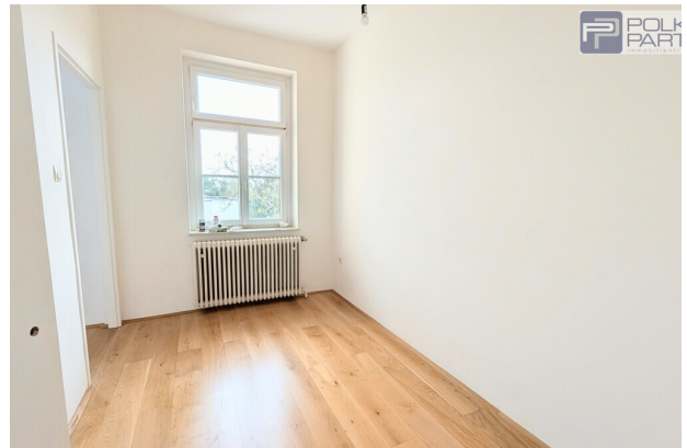
Essbereich vor Küche