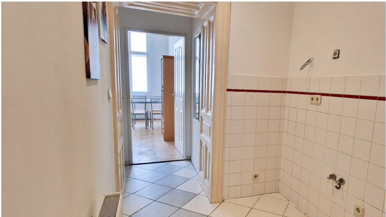
Vorraum mit Anschlüssen für Küchezeile