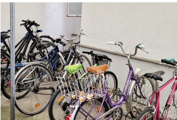
Platz für Fahrräder