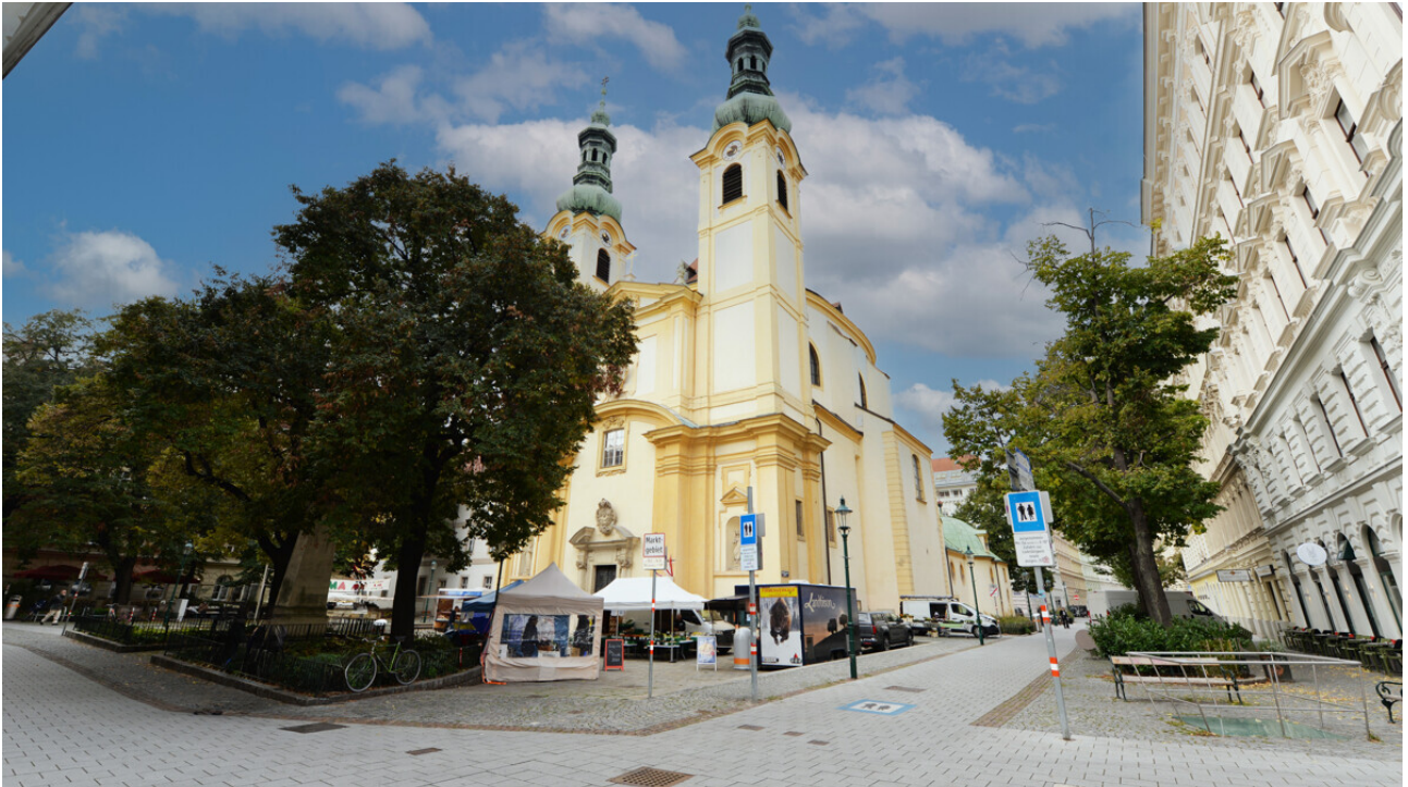
Nahe gelegene Servitenkirche