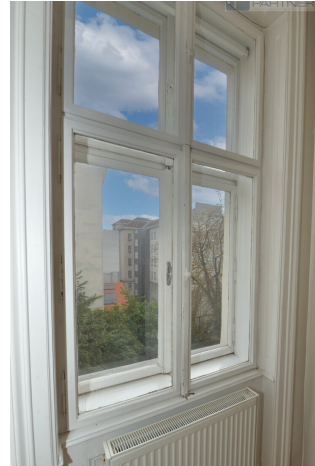
Fenster-Blick in den weitläufigen Hof